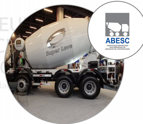
Caminhões e mescladoras ultra leves – (-2,4Ton)