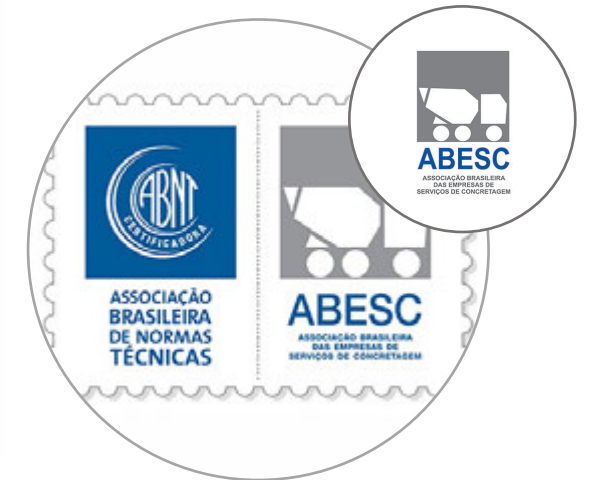
Certificacion de plantas Abesc/ABNT Plantas