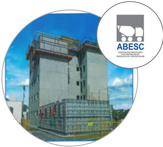
Muros de concreto para edifícios altos