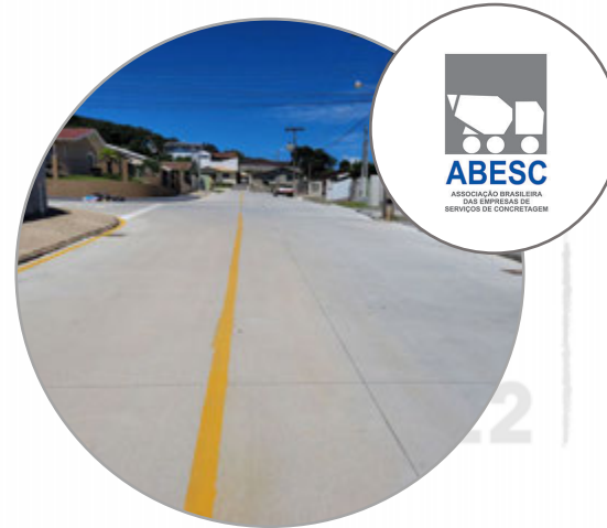
Pavimentos de concreto para vias urbanas